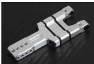
新しくなった3ピース構造のサスアーム