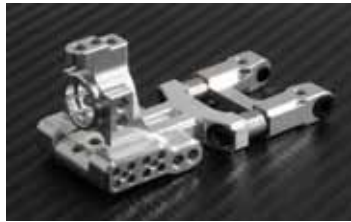
センターカラー未装着。6mmカラー取付例(カラーは付属しません。)

0152-FD ~ 0159-FD 近藤カスタム脚 VX サスペンションシステム Ver.2 各種¥12,000 (税別)