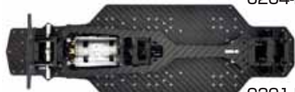
0201-FD BLACK 0205-FD BLACK