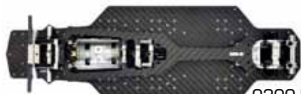
0200-FD SILVER 0204-FD SILVER