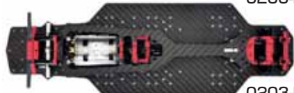
0203-FD RED 0207-FD RED