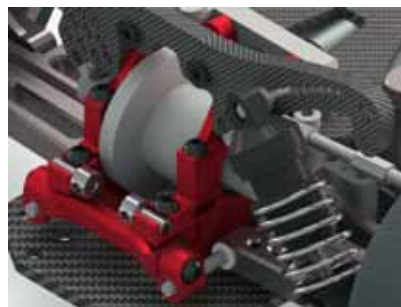
左上:シャーシ搭載例 右上:フローティングサスマウント 右下:別体型スタビホルダー

スペーサーによる調整で ロールセンター(スキッド) &トーインの調整が自在に 行えます。