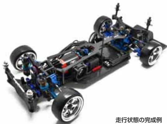
走行状態の完成例